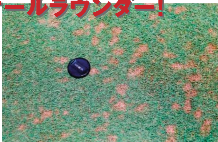
ダラースポット病