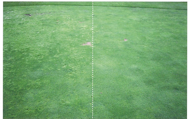
左：無処理区 右：タスク 39DF (0.045g/㎡ 2回処理区)

処理日：2013年4月16日、5月24日 調査日：2013年6月24日 試験場所：奈良県ゴルフ場（パッティンググリーン） 散布水量：200ml/㎡