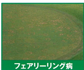
フェアリーリング病