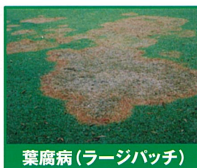
葉腐病(ラージパッチ)